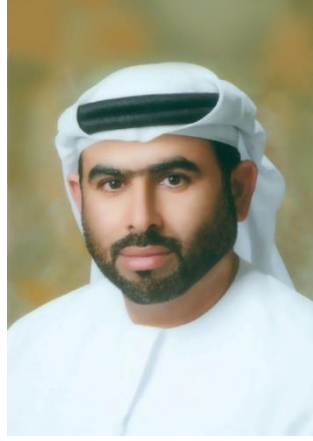
الأستاذ/ بطي الفلاسي مدير إدارة الإعلام الأمني بشرطة دبي